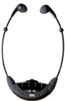
LR-42 IR Stethoskop 4-Kanal-Empfänger