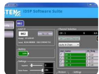
Die Listen iDSP Software Suite