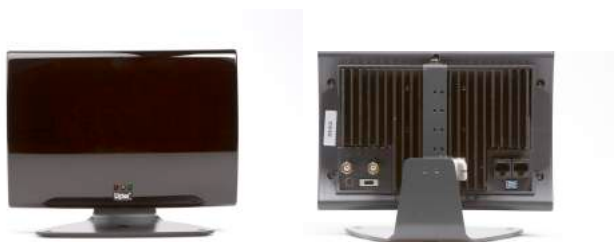
LA-140 Stationärer Strahler